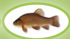
Schleie - 25 cm

Sie einen Fisch, der kleiner ist als das Mindestmaß für diese Fischart, so müssen Sie ihn sofort wieder in das gleiche Gewässer zurücksetzen!