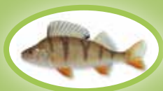
Barsch - 22 cm