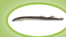
Flussneunauge - 20 cm