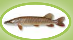
Hecht - 45 cm