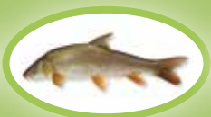
Barbe - 30 cm