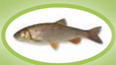
Döbel - 30 cm