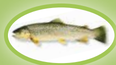
Bachforelle - 25 cm