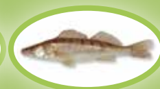
Zander - 42 cm