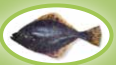
Flunder - 20 cm